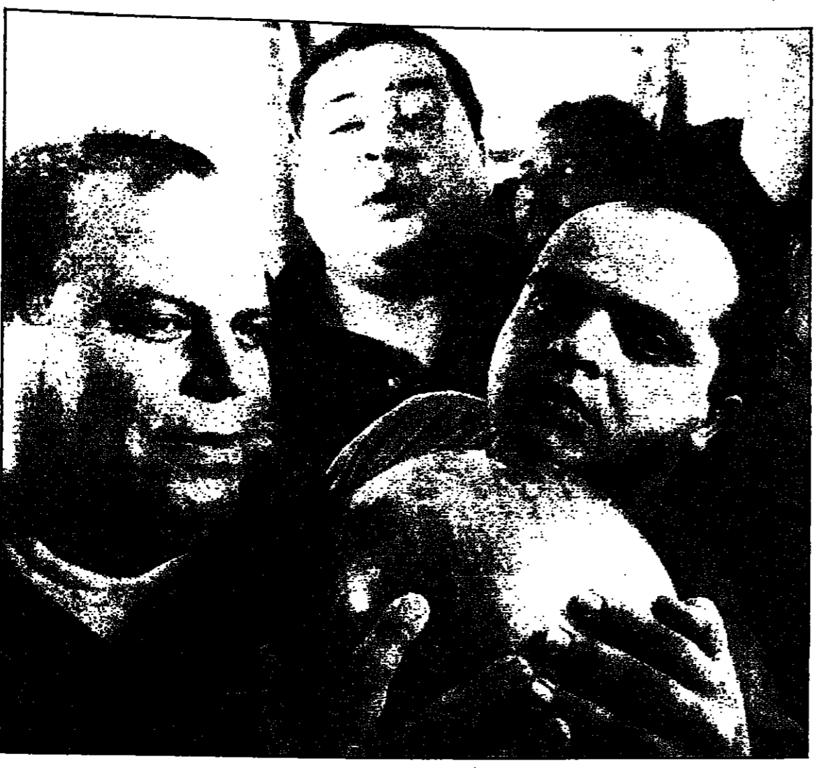
محمد هنيدي في مشهد من أحد أفلامه